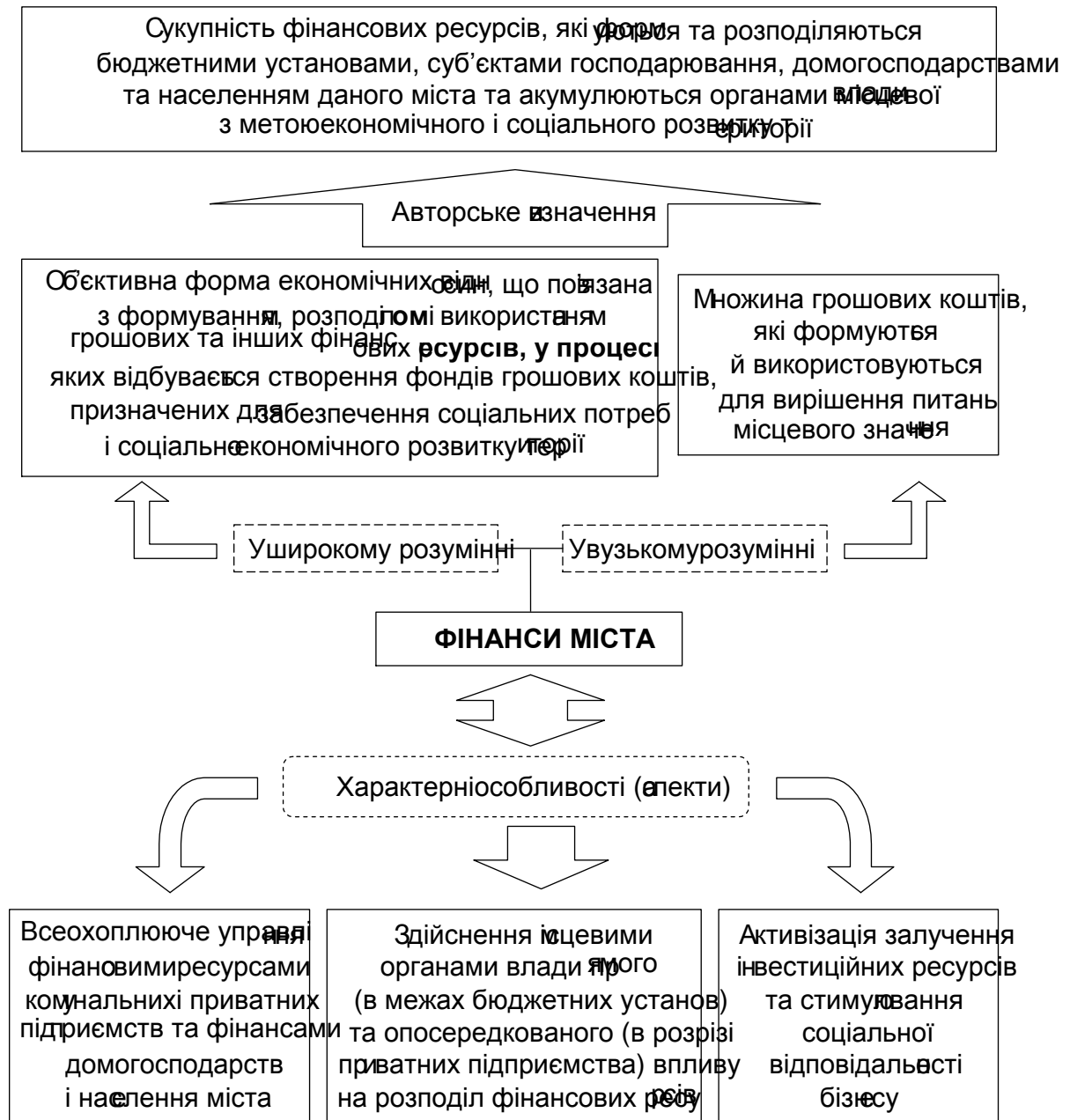
Рис. 1. Формування підходу до визначення сутності фінансів міста

домогосподарствами та населенням даного міста та акумулюються органами місцевої влади з метою економічного і соціального розвитку території. Таким чином, формалізацію підходу до визначення сутності фінансів міста можна подати за допомогою рис. 1.